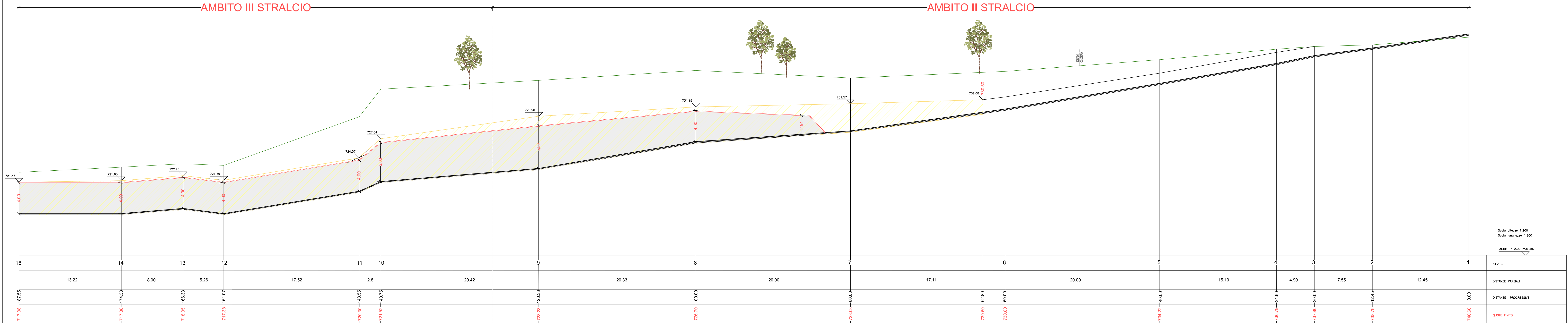
SEZIONI MURI DI SOSTEGNO scala 1:20